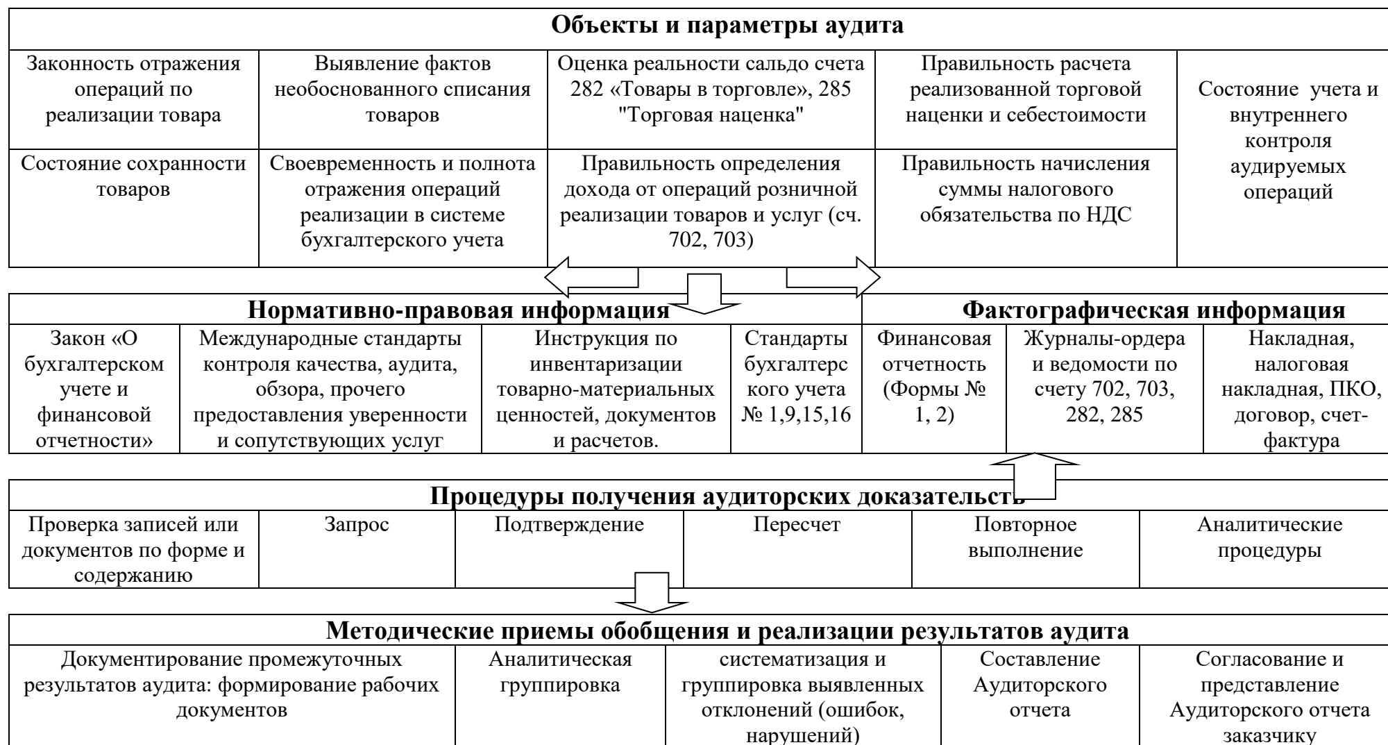
Рис. Организационная модель методики аудита операций розничной реализации товаров и услуг